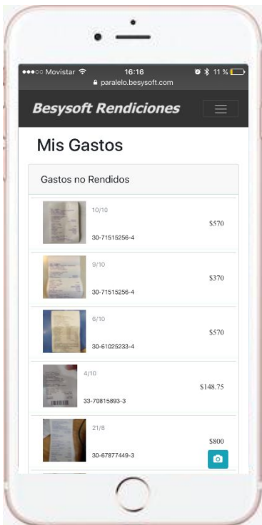
Vista Captura de Datos